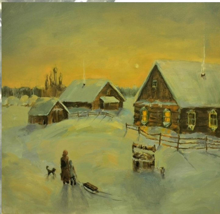
Автор: Амелия Калужная, ИЗО-21