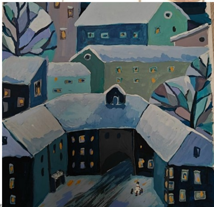
Автор: Мария Марусева, ИЗО-11

Председатель редакционного совета: И.А. Клименко