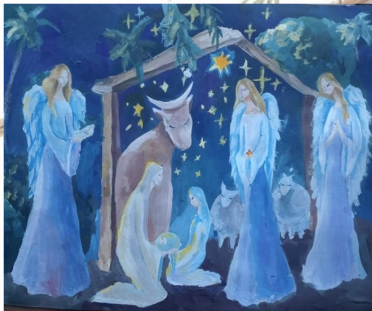
Автор: София Шебаршина, ИЗО-11