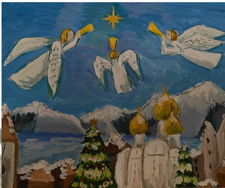
Автор: Мария Марусева, ИЗО-11