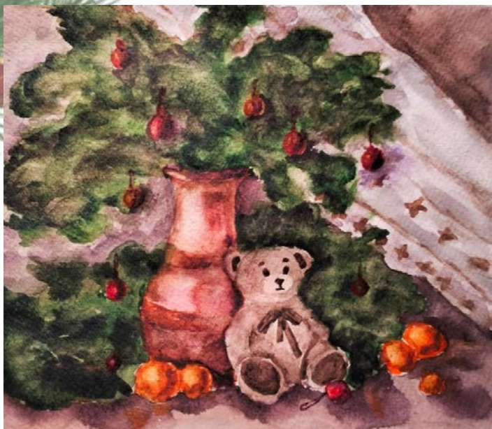
Автор: Амелия Калюжная, ИЗО-11