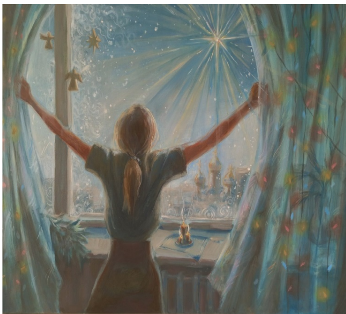
Автор: Екатерина Семкина, ИЗО-31